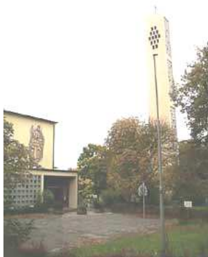
Kościół Hl. Familie

Telefon: 0611 - 30 81 82 1 Fax: 0611 - 15 76 78 8 E-Mail: biuro@pmk-wiesbaden.eu