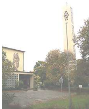
Kościół Hl. Familie Lessingstr. 19